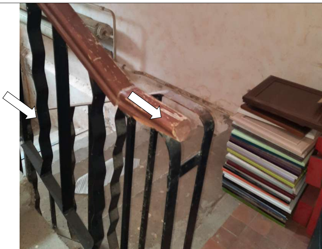
Фото № 8. Поручень с одной стороны лестницы, прерывающийся по длине