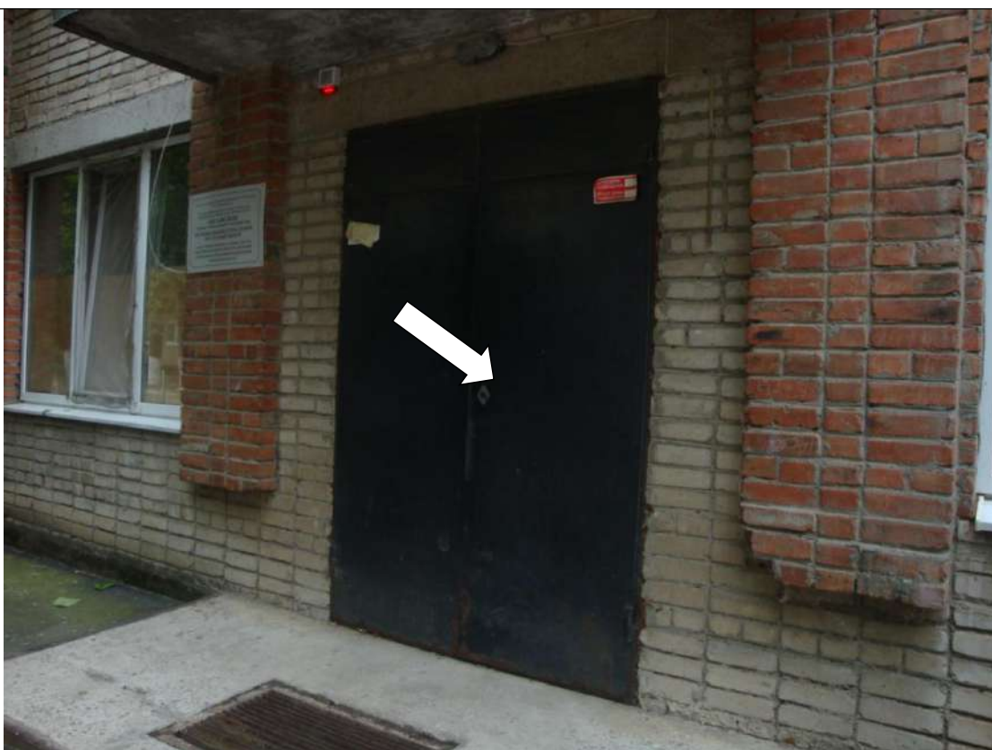
Фото № 2. Не установлена дверная ручка на входной двери