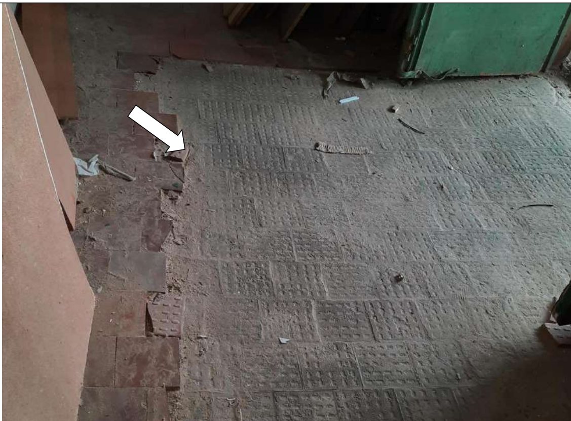
Фото № 5. Неровный пол в коридоре

ГБПОУ РО ПУ №56 Мастерские, по адресу: Ростовская область, г. Аксай, ул. Шолохова, д.4, литер Б