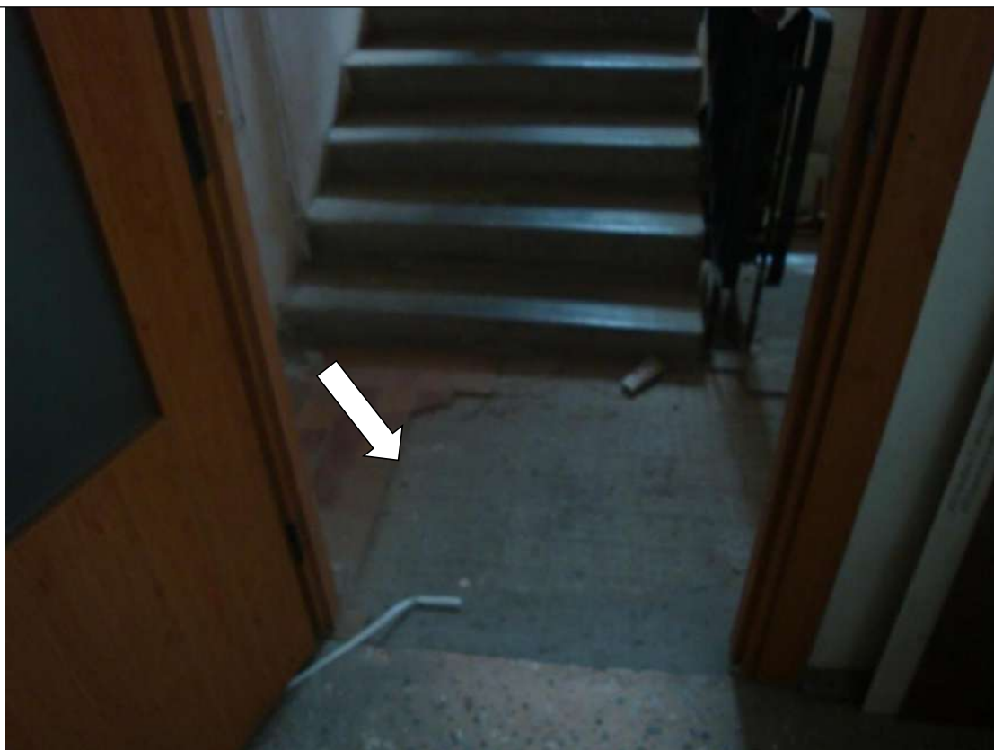
Фото № 6.