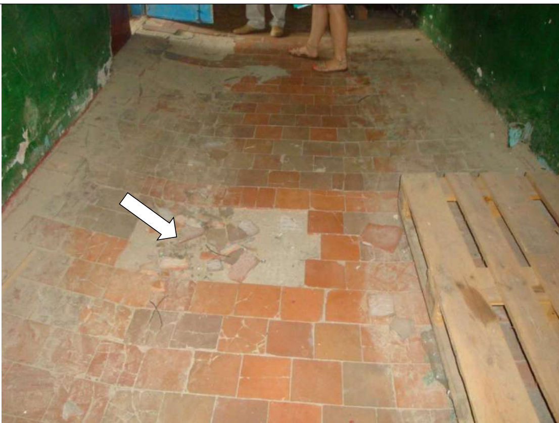
Фото № 4. Разрушенная плитка