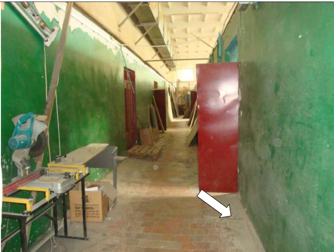
Фото № 3. Уклон пола в коридоре

ГБПОУ РО ПУ №56 Мастерские, по адресу: Ростовская область, г. Аксай, ул. Шолохова, д.4, литер Б