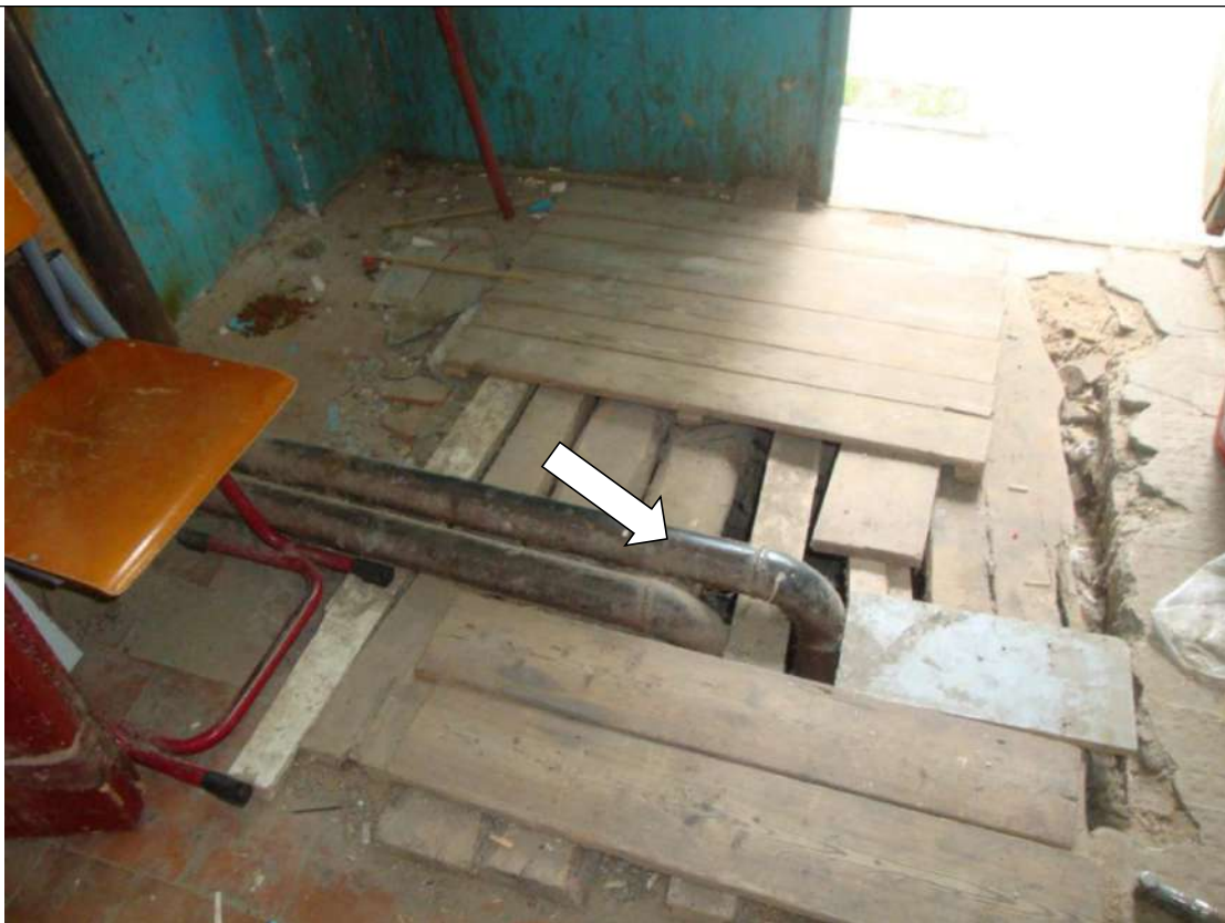
Фото № 7. Разрушенная поверхность пола с выступающими трубами отопления

ГБПОУ РО ПУ №56 Мастерские, по адресу: Ростовская область, г. Аксай, ул. Шолохова, д.4, литер Б