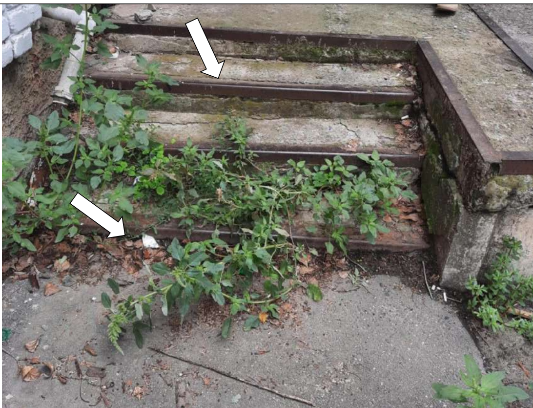
Фото № 10. Ступени на эвакуационном выходе не одинаковой высоты