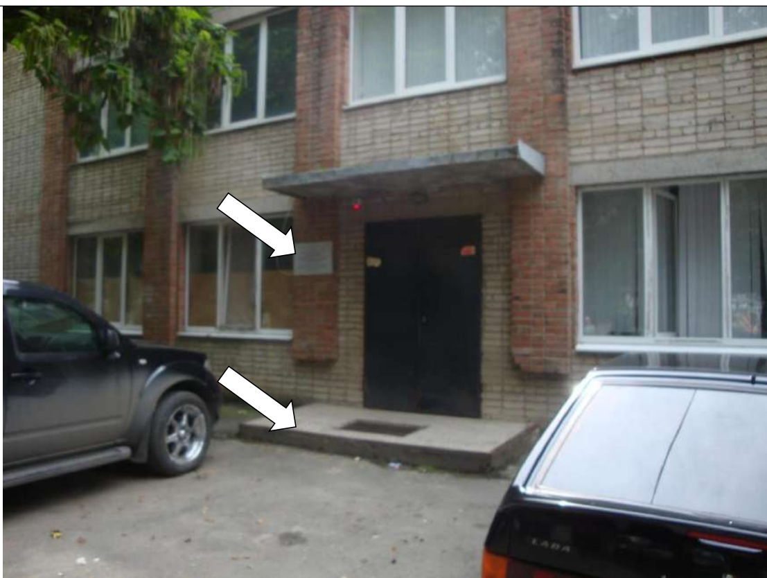
Фото № 1. Табличка об объекте расположена в недоступном месте. Край входной площадки контрастно не маркирован

ГБПОУ РО ПУ №56 Мастерские, по адресу: Ростовская область, г. Аксай, ул. Шолохова, д.4, литер Б