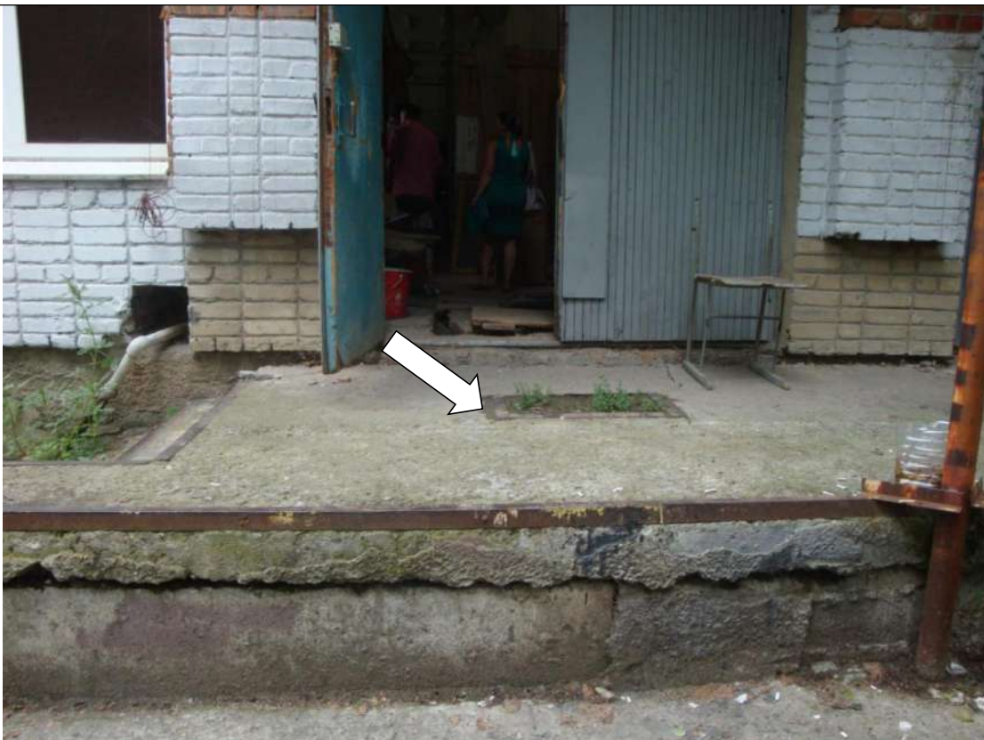
Фото № 9. Покрытие входной площадки на эвакуационном выходе неровное. Нет ограждения

ГБПОУ РО ПУ №56 Мастерские, по адресу: Ростовская область, г. Аксай, ул. Шолохова, д.4, литер Б