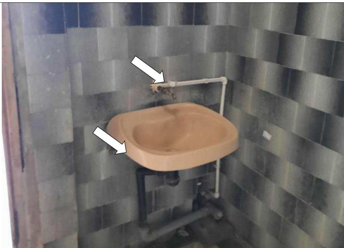
Фото № 28. Кран поворотного типа, нет опорных поручней возле раковины