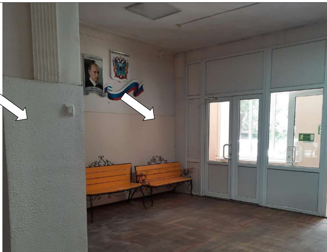
Фото № 8. В вестибюле нет информирующих обозначений, указателей