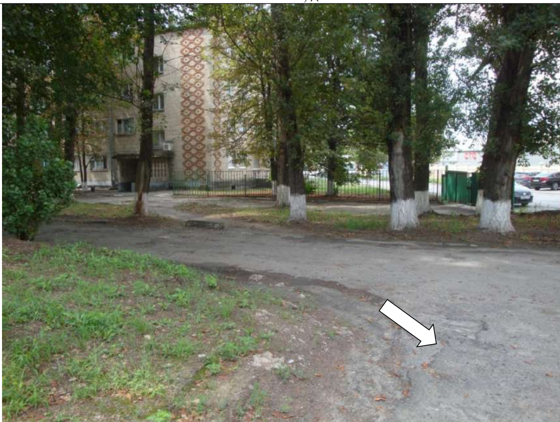
Фото №3. Покрытие поверхности по пути движения по территории имеет неровности

ГБПОУ РО ПУ №56 Административно-учебный корпус, по адресу: Ростовская область, г. Аксай, ул. Шолохова, д.4