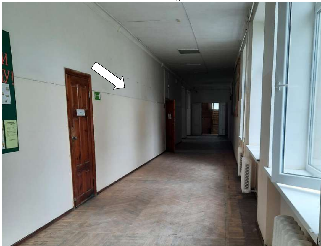
Фото №9. Нет информирующих обозначений в коридорах

ГБПОУ РО ПУ №56 Административно-учебный корпус, по адресу: Ростовская область, г. Аксай, ул. Шолохова, д.4