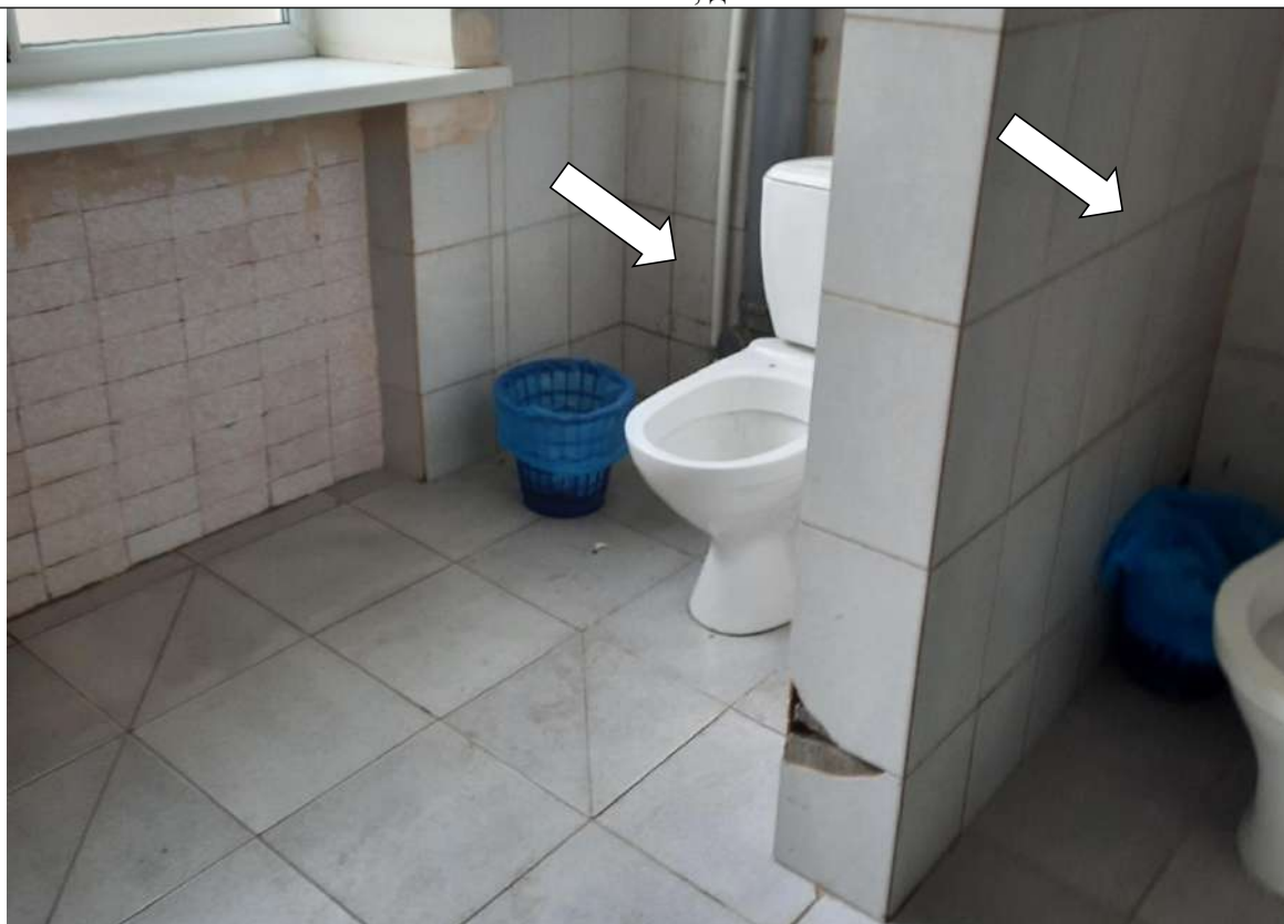
Фото № 27. Нет опорных поручней, крючков для костылей в мужском туалете

ГБПОУ РО ПУ №56 Административно-учебный корпус, по адресу: Ростовская область, г. Аксай, ул. Шолохова, д.4