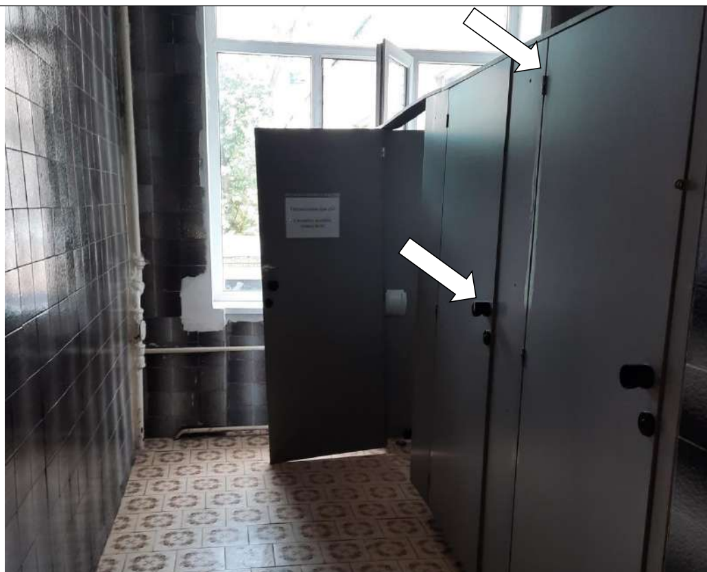
Фото № 30. Дверные проемы на кабинках не контрастны, дверные ручки круглые