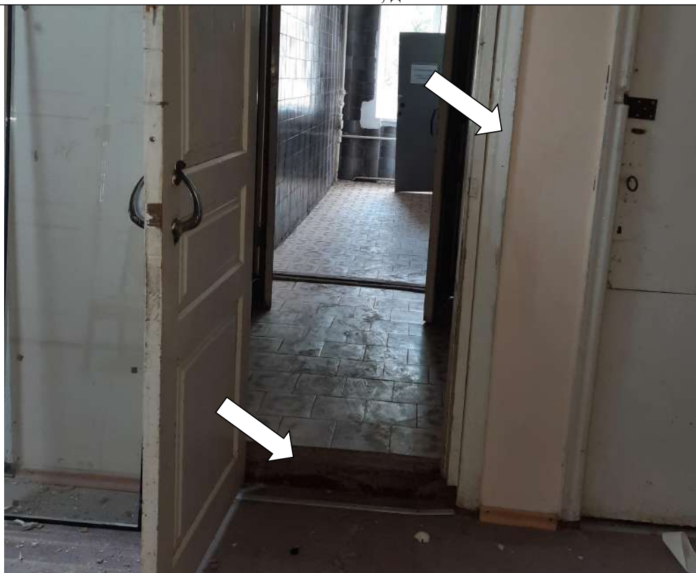
Фото № 29. Вход в женский туалет. Перепад высоты в дверном проеме. Дверной проем контрастно не маркирован

ГБПОУ РО ПУ №56 Административно-учебный корпус, по адресу: Ростовская область, г. Аксай, ул. Шолохова, д.4