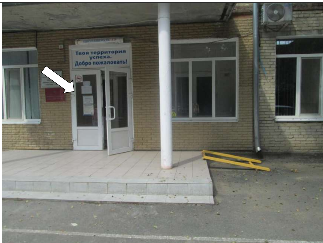
Фото № 6. Дверной проем и дверная ручка контрастно не маркированы