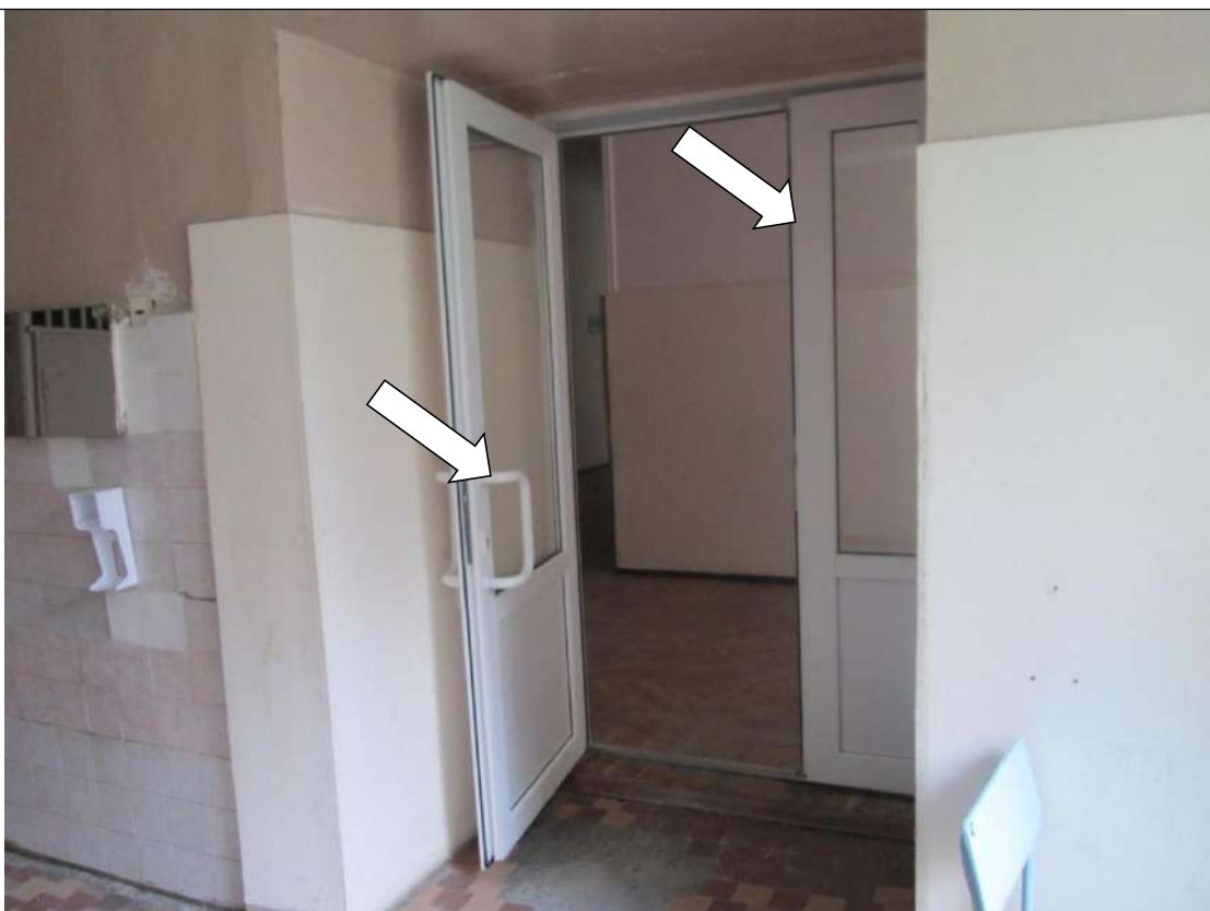
Фото № 22. Дверной проем, дверная ручка на входе в столовую контрастно не маркированы