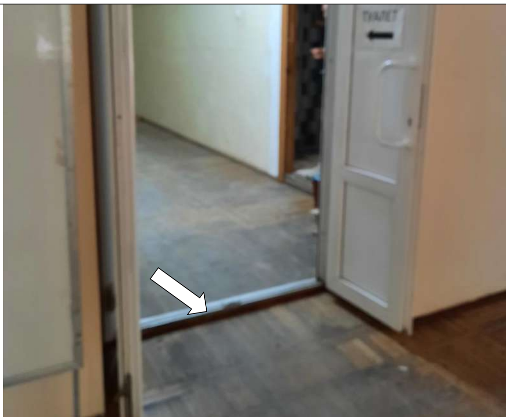
Фото № 12. Порог в дверном проеме по пути движения