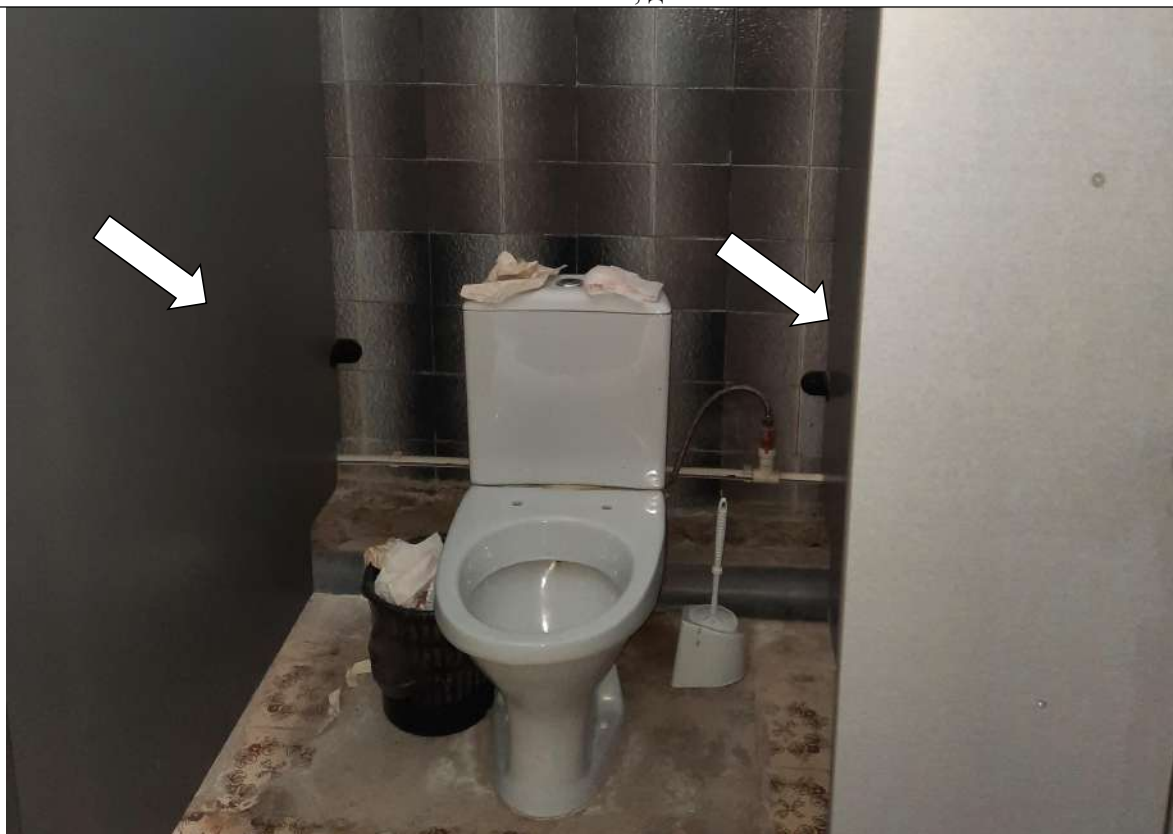
Фото № 31. Нет опорных поручней возле унитаза

ГБПОУ РО ПУ №56 Административно-учебный корпус, по адресу: Ростовская область, г. Аксай, ул. Шолохова, д.4