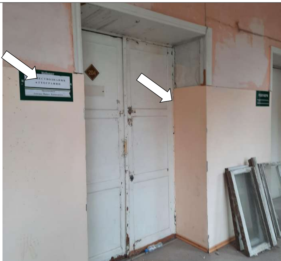
Фото № 20. Дверной проем контрастно не маркирован. Информационная табличка о назначении кабинета не тактильная