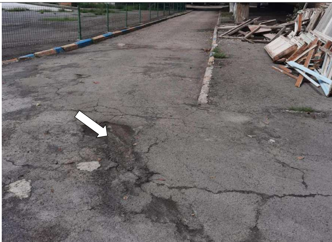
Фото №4. Неровное покрытие по пути движения к главному входу.