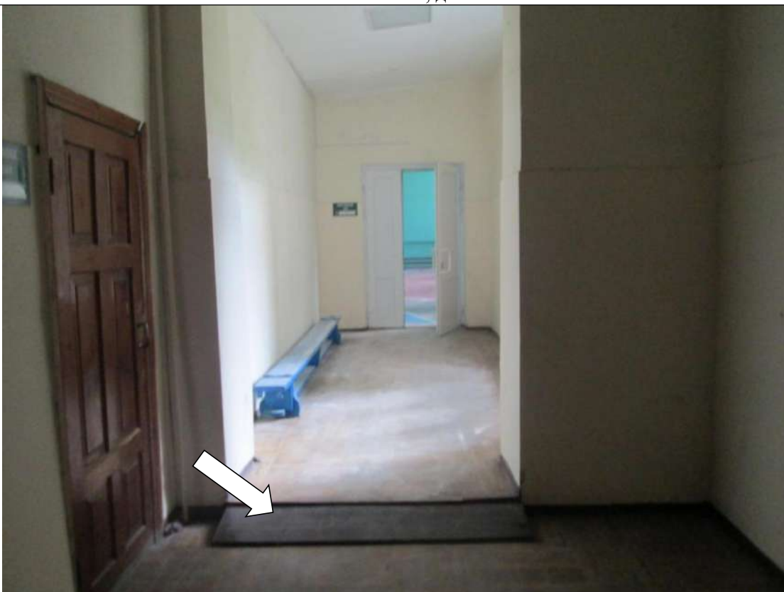
Фото № 11. Пандус по пути к спортивному залу

ГБПОУ РО ПУ №56 Административно-учебный корпус, по адресу: Ростовская область, г. Аксай, ул. Шолохова, д.4