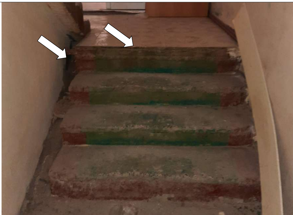
Фото № 18. Нет поручней на лестнице ведущей к эвакуационному выходу из коридора. Краевые ступени контрастно не маркированы.