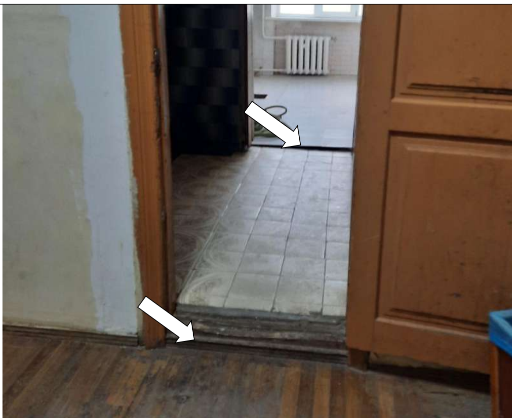
Фото № 26. Вход в мужской туалет. Перепад высоты в дверных проемах