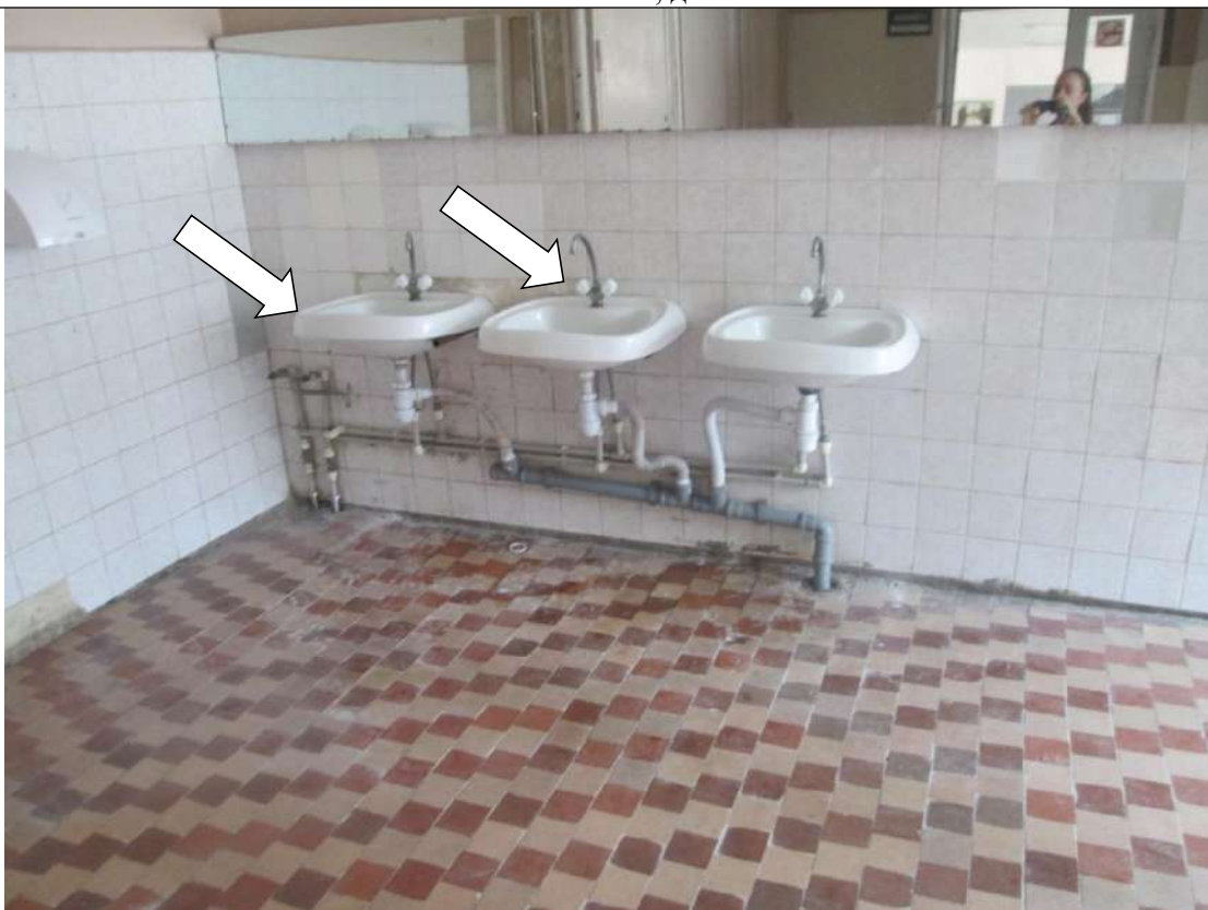
Фото № 23. На раковинах в столовой краны поворотного типа, нет опорных поручней возле раковины

ГБПОУ РО ПУ №56 Административно-учебный корпус, по адресу: Ростовская область, г. Аксай, ул. Шолохова, д.4