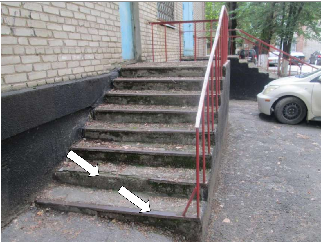
Фото № 16. Эвакуационный выход с торца здания. Ступени частично разрушены, контрастно не маркированы, поручень с одной стороны лестницы