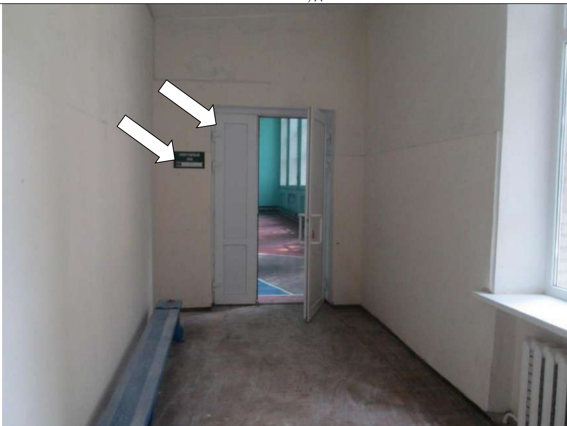
Фото № 21. Дверной проем, дверная ручка на входе в спортивный зал контрастно не маркированы. Информационная табличка не тактильная

ГБПОУ РО ПУ №56 Административно-учебный корпус, по адресу: Ростовская область, г. Аксай, ул. Шолохова, д.4