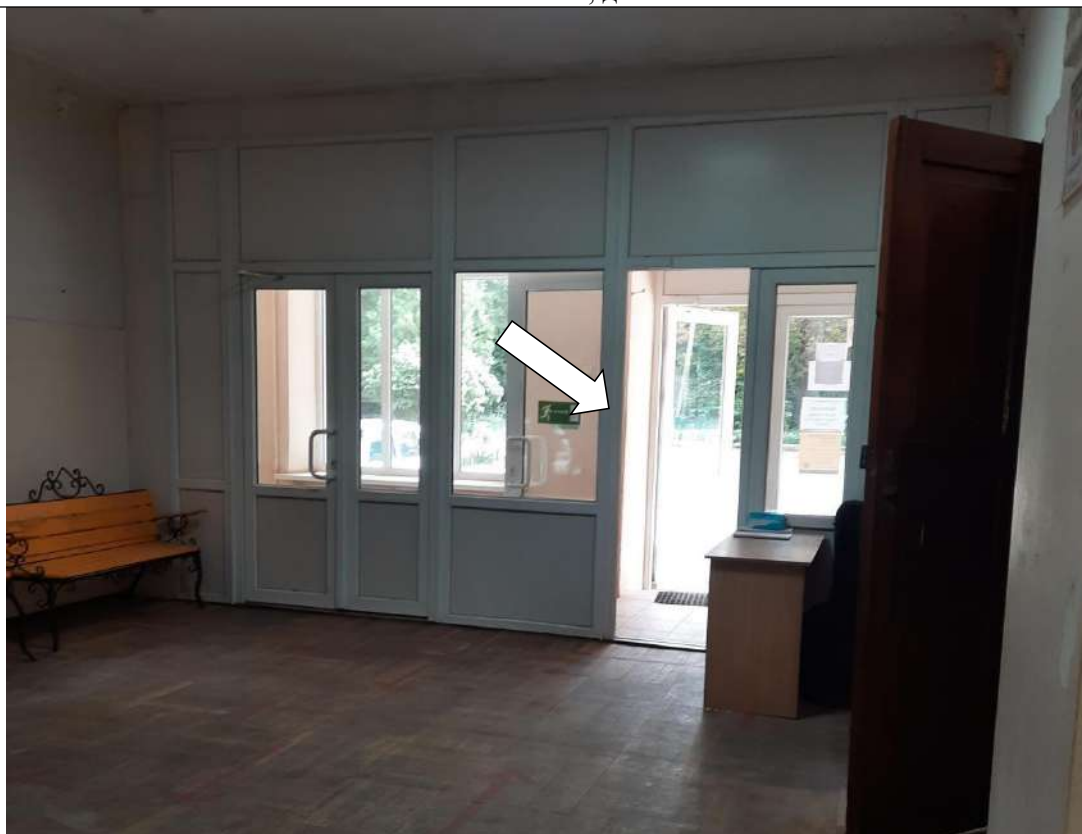
Фото № 7. Дверной проем в тамбуре контрастно не маркирован

ГБПОУ РО ПУ №56 Административно-учебный корпус, по адресу: Ростовская область, г. Аксай, ул. Шолохова, д.4