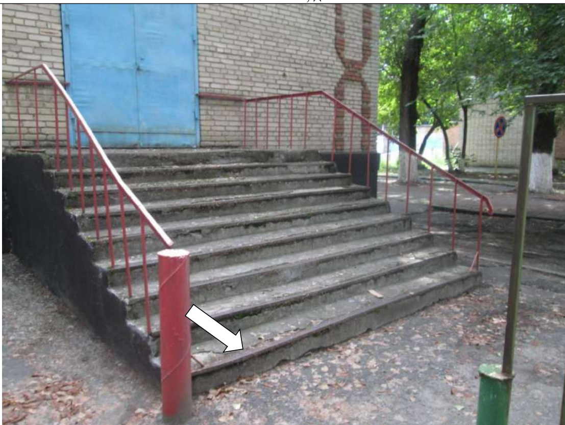
Фото № 17. Эвакуационный выход с торца здания. Ступени частично разрушены, контрастно не маркированы, поручни на лестницы с травмирующим завершением.

ГБПОУ РО ПУ №56 Административно-учебный корпус, по адресу: Ростовская область, г. Аксай, ул. Шолохова, д.4