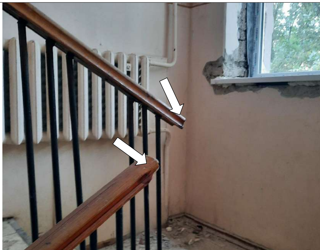
Фото №10. Поручни прерывающиеся по длине