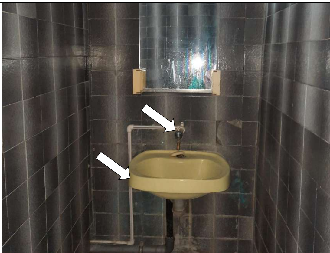
Фото № 32. Кран поворотного типа, нет опорных поручней возле раковины