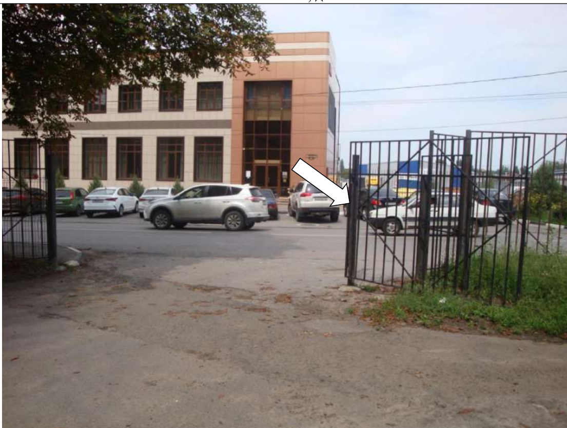
Фото № 1. Нет информационной таблички об объекте

ГБПОУ РО ПУ №56 Административно-учебный корпус, по адресу: Ростовская область, г. Аксай, ул. Шолохова, д.4