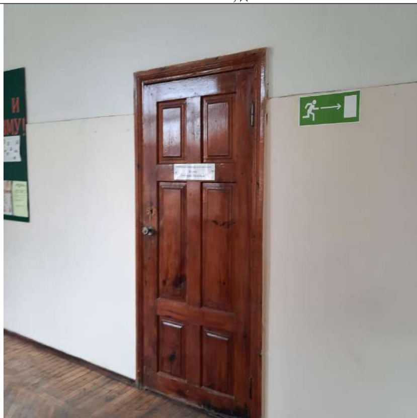
Фото № 19. Нет информирующих обозначений на кабинете

ГБПОУ РО ПУ №56 Административно-учебный корпус, по адресу: Ростовская область, г. Аксай, ул. Шолохова, д.4