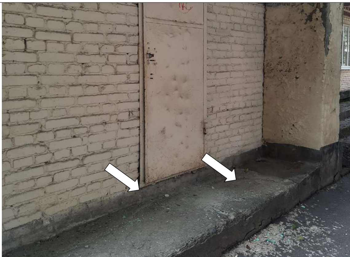
Фото № 14. Перепад высоты в дверном проеме, узкая входная площадка на эвакуационном выходе