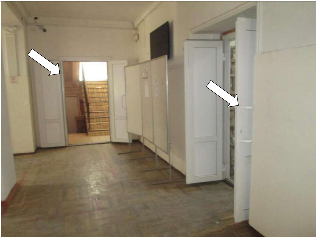
Фото № 13. Дверной проем и дверные ручки контрастно не маркированы. Порог в дверном проеме

ГБПОУ РО ПУ №56 Административно-учебный корпус, по адресу: Ростовская область, г. Аксай, ул. Шолохова, д.4