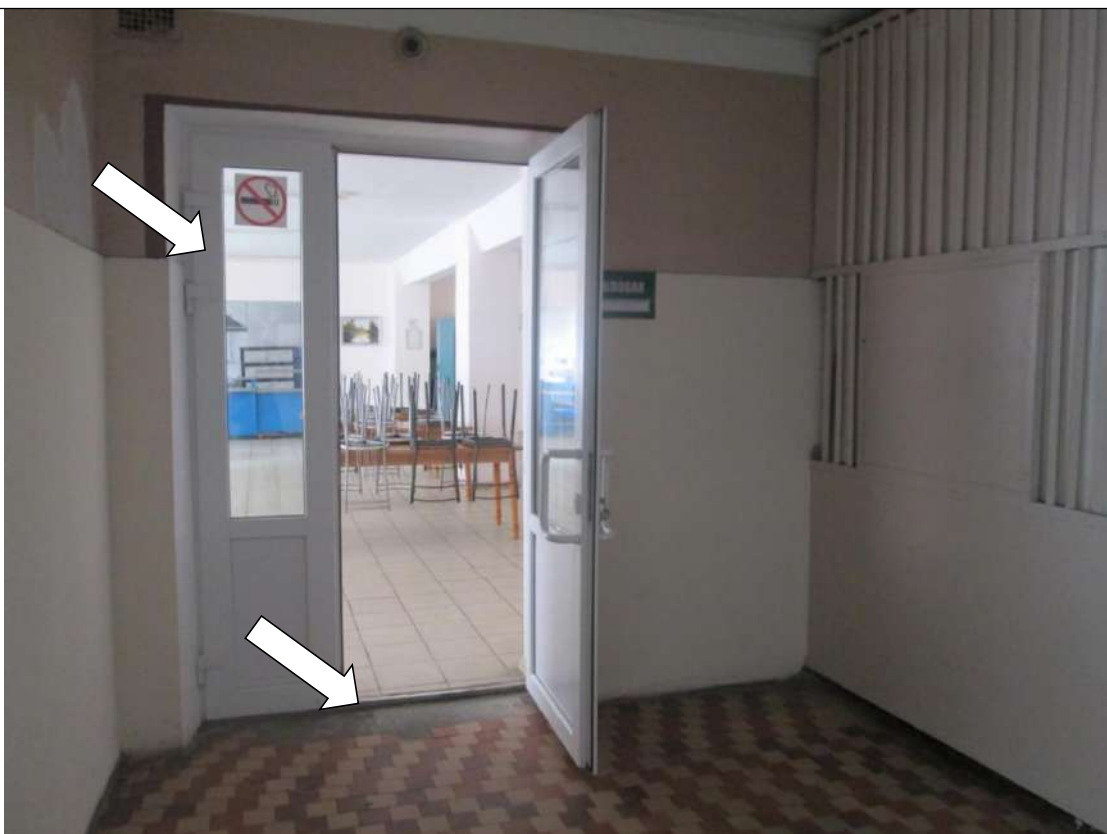
Фото № 24. Дверной проем в столовой контрастно не маркирован. В дверном проеме имеется перепад высоты