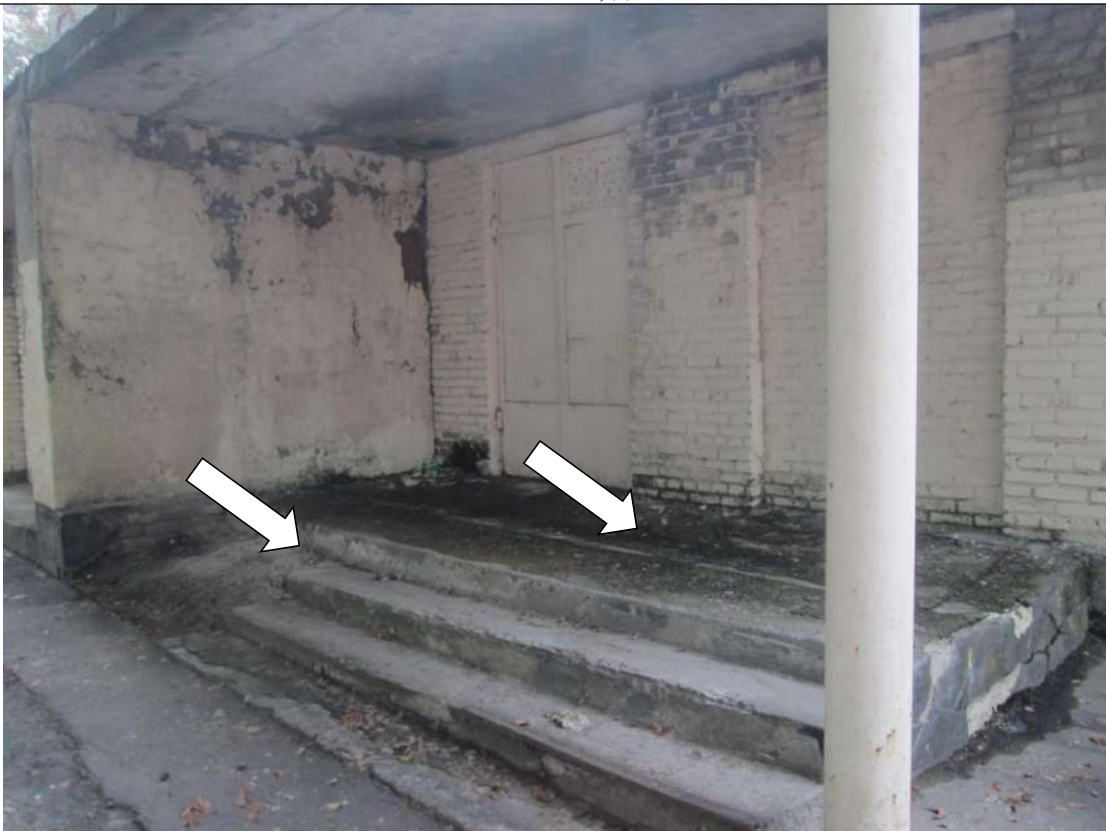
Фото № 15. Эвакуационный выход из зала столовой. Неровная входная площадка. На лестнице нет поручней, ступени разрушены

ГБПОУ РО ПУ №56 Административно-учебный корпус, по адресу: Ростовская область, г. Аксай, ул. Шолохова, д.4