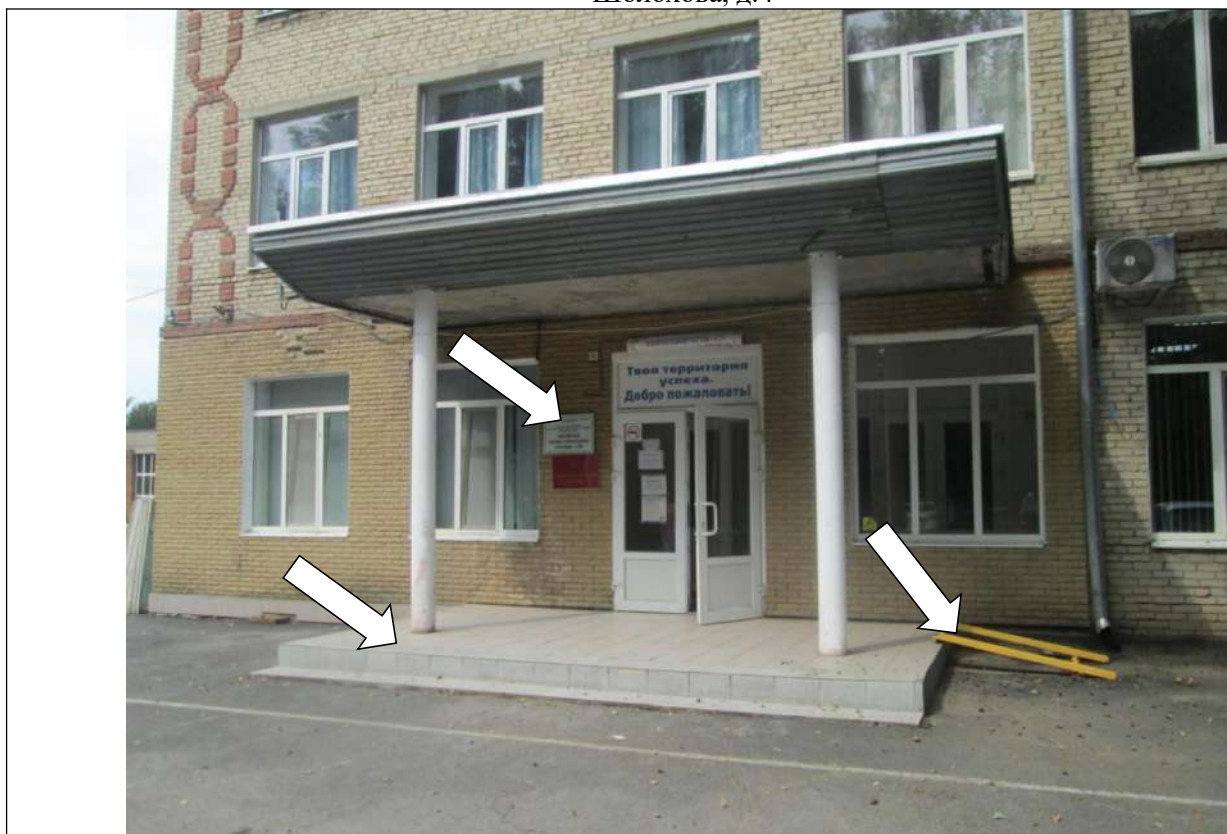
Фото № 5. Установлены аппарели, край входной площадки контрастно не маркирован. Табличка об объекте расположена в недоступном месте

ГБПОУ РО ПУ №56 Административно-учебный корпус, по адресу: Ростовская область, г. Аксай, ул. Шолохова, д.4