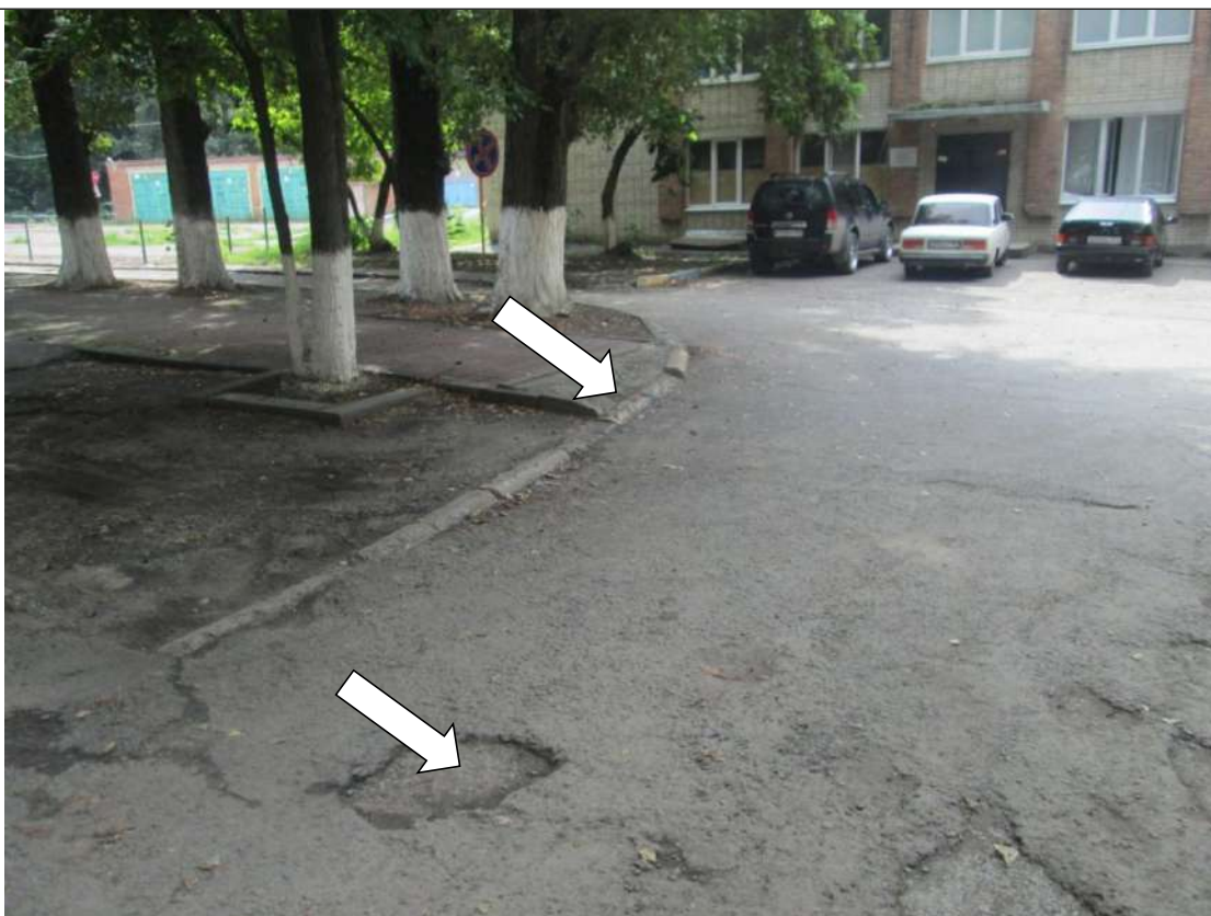
Фото № 2. Нет бордюрного пандуса. Покрытие поверхности по пути движения по территории имеет неровности